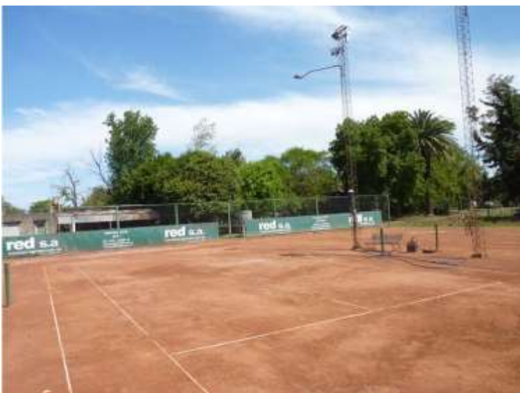
Cancha de Tenis

Actualmente cuenta con un salón social para eventos. Restaurante de comidas. Campo de deportes: tres Canchas de bochas, dos Canchas de tenis y una de frontón. Como parte de su fin recreativo, en el ámbito de la asociación, se practican diversas disciplinas que hacen parte de las actividades principales de sus asociados: Escuela de Danzas Clásicas. Escuela de Danzas Contemporáneas, bochas, tenis y frontón.