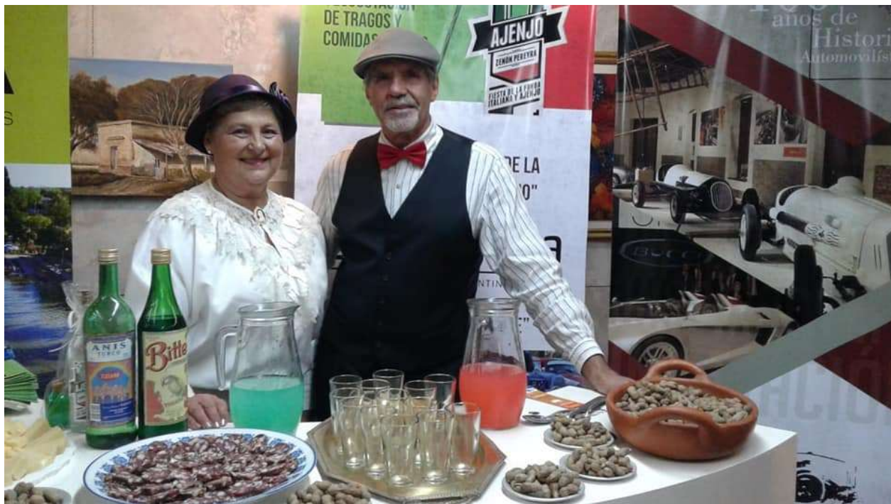
Representación Fonda Italiana.

La Asociación Italiana y Familia Piamontesa, en forma conjunta con el Grupo de teatro de Zenón Pereyra, participan anualmente de la FIESTA PROVINCIAL DE LA FONDA ITALIANA Y EL AJENJO realizando la representación de la misma y ofreciendo la degustación del típico trago. En varias ocasiones, han hecho su presentación para la F.A.P.A., en fiestas de localidades de la región a la que ha sido convocada.